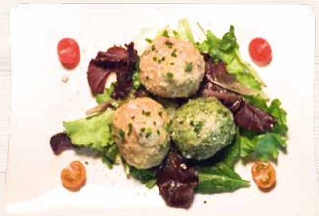
Knödeltris / Tris di canederli