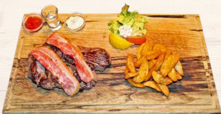
Bud-Spencer-Steak | Il steak di Bud Spencer

„Padella di Terence Hill“ Bistecca di maiale ca. 300 gr. ai ferri con verdure alla griglia, su rösti ai "piedi piatti", servito in padella di ferro originale