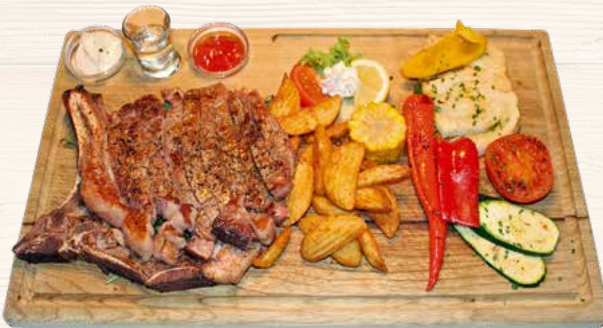
Hochrippensteak / Costata

Costata ca. 600 gr. con verdura grigliata, spicchi di patate, salsa all'aglio e barbecue, servito sul tagliere di legno