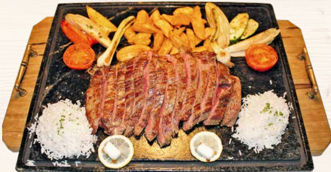
Christians Haussteak / Christians steak di casa