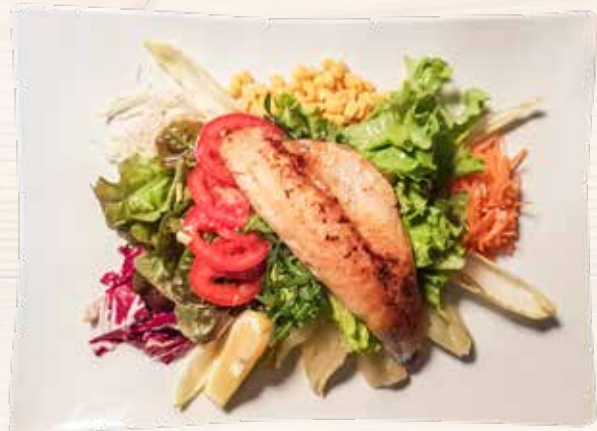
Großer Salatteller mit gegrilltem Zanderfilet Insalatone grande con filetto di lucioperca alla griglia