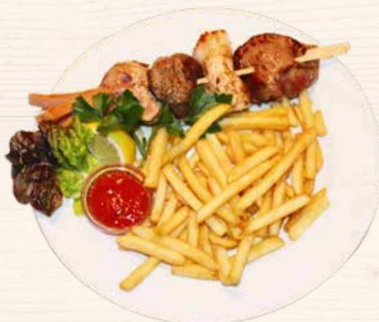
Gandlers Fleischspieß / Spiedino di carne mista