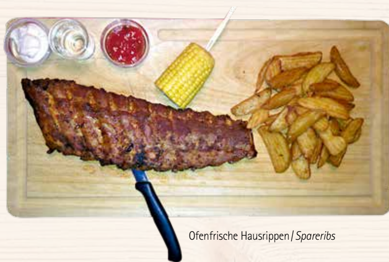
Ofenfrische Hausrippen / Spareribs

Spiedino di carne mista (vitello, tacchino, manzo, maiale e würstel) con salsa di barbecue, patate fritte