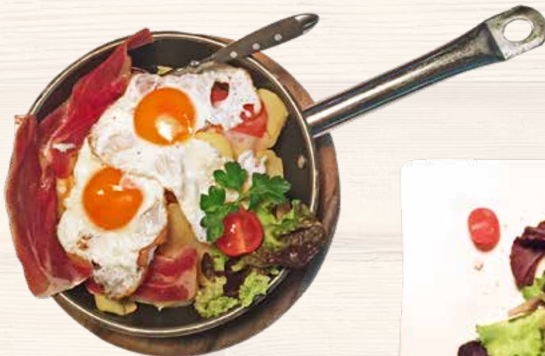
Bergsteiger Pfandl / Padella dell'Alpinista

Mutters Kaiserschmarren mit Rosinen und Preiselbeermarmelade 11,00 € Omelette a pezzetti , con uvetta e marmellata di mirtilli rossi fatto dalla mamma