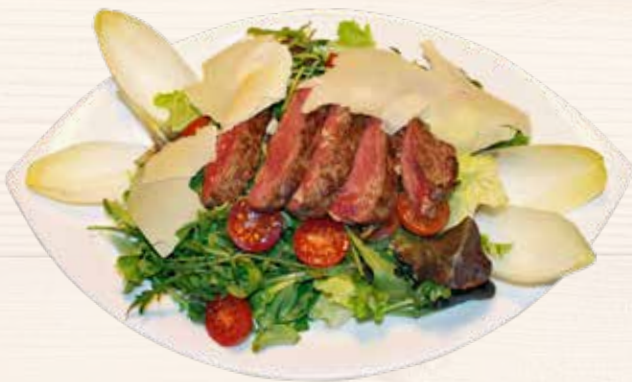
Rinds Tagliata auf Blattsalat/ Tagliata di manzo su insalata