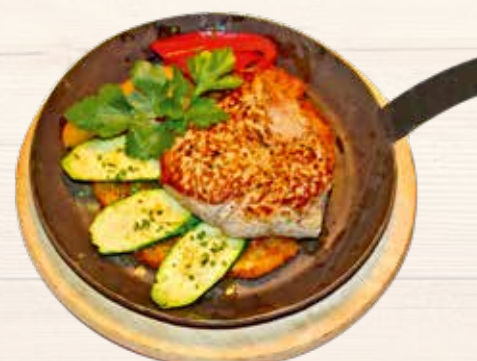
Terence Hill Pfandl | Padella di Terence Hill