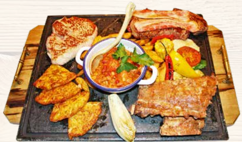
Grillplatte Bud Spencer / Grigliata di Bud Spencer