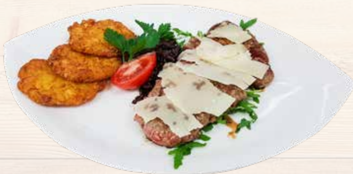
Rinds-Tagliata / Tagliata di manzo