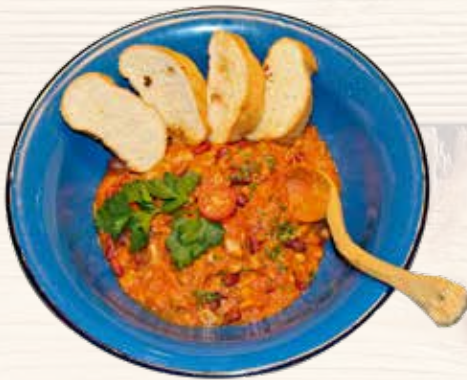
Auch die Engel essen Bohnen Anche gli angeli mangiano fagioli