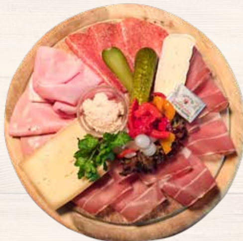
Aufschnittteller / Affettato misto

Tiroler Aufschnittteller für 1 oder 2 Pers. mit Brotkorb 1 Person / persona 15,00 € Affettato misto tirolese per 1 o 2 per. con pane 2 Personen / persone 27,00 €